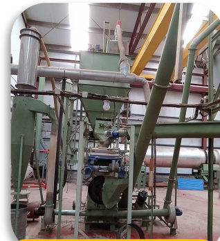
Molienda (8 mm)