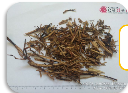
Fracción gruesa ( > 4 mm)