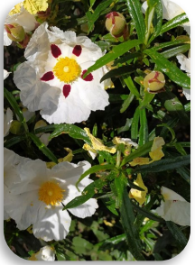
El Ordial (Guadalajara)