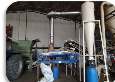
Cribado y venteo para eliminación de polvo