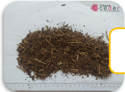
Fracción fina ( < 4 mm)